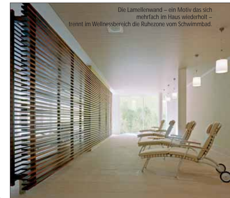
Die Lamellenwand – ein Motiv das sich mehrfach im Haus wiederholt – trennt im Wellnessbereich die Ruhezone vom Schwimmbad.